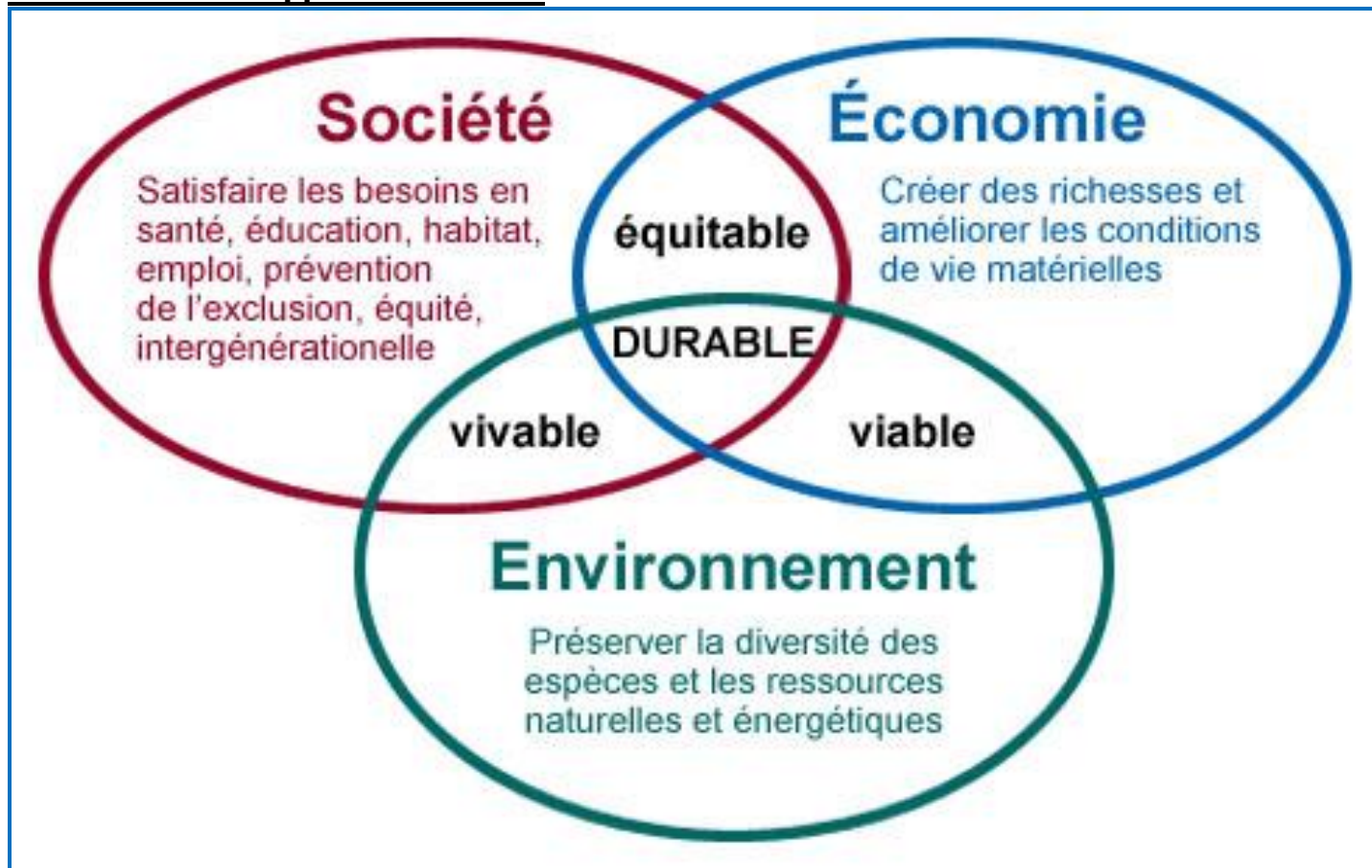
Schéma du développement durable